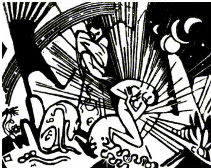
Franz Marc: Versöhnung (Holzschnitt), 1912