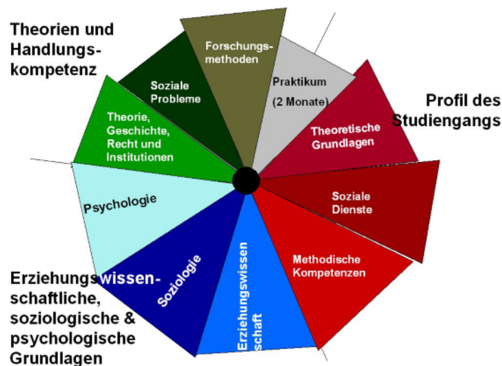
Abb.1: Sozialpädagogik als Schwerpunkt – Modulfelder BA