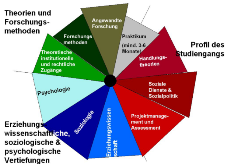
Abb.1: Sozialpädagogik als Schwerpunkt – Modulfelder MA