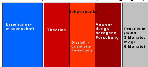
Abb.1: Sozialpädagogik als Hauptfach – Modulfelder MA